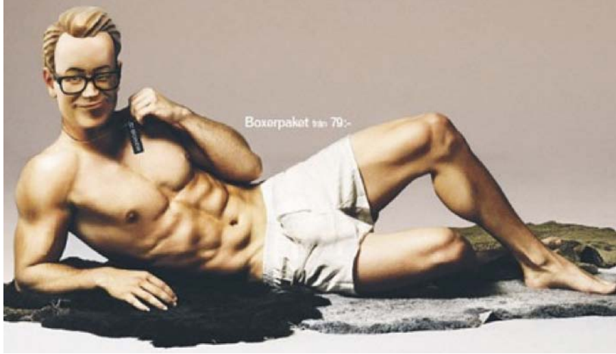
Anuncio sobre el canal televisivo sueco 'Boxer'

¿Por qué creéis que esta perpetuación de los roles se sigue usando como estrategia de marketing ?